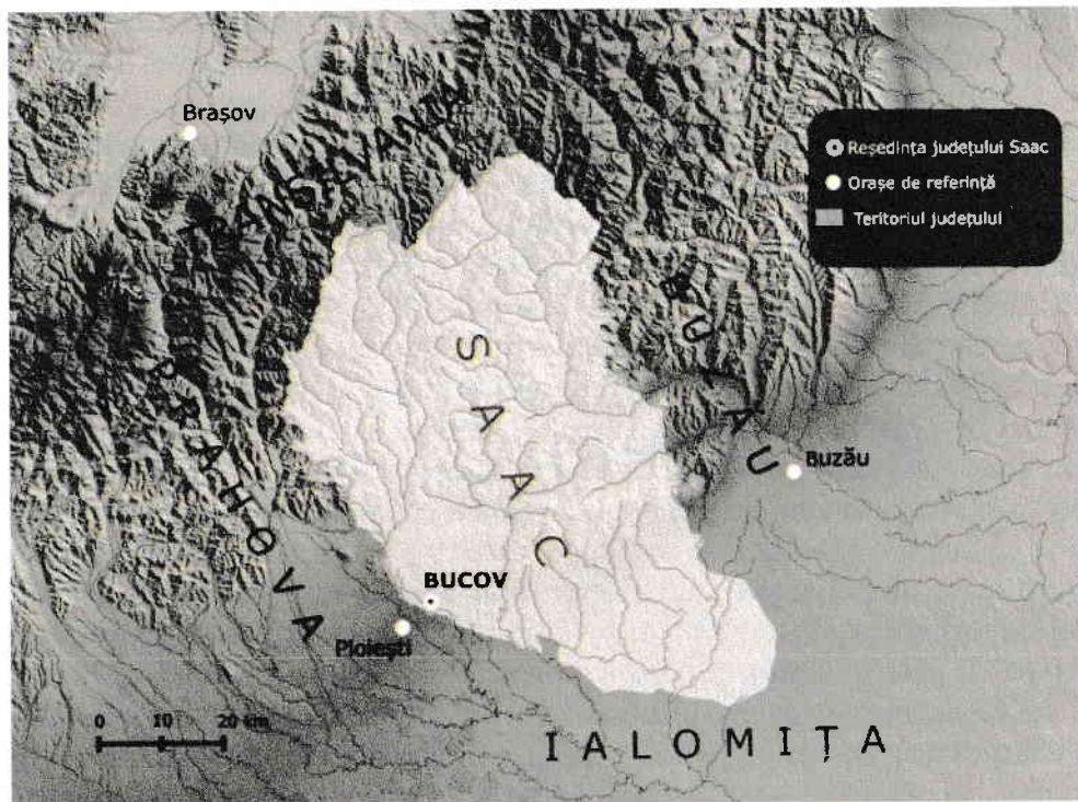
Județul Săcuieni, poziția geografică.

cu Principatul Moldovei, dar și lângă Transilvania, pe atunci înglobată în Imperiul Habsburgic (Austro-Ungar, din 1868). Aceste contacte cu cele două regiuni au contribuit la formarea încă din vechime a unei arii culturale aparte.